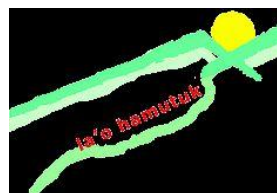
Timor-Leste Institute for Development Monitoring and Analysis