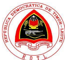
Embaixada da República Democrática de Timor-Leste em Portugal

A realização desta conferência foi possível graças ao apoio generoso de: